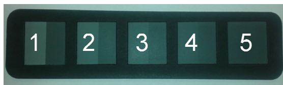
Figura 2: Esempio della scala di grigi

I filamenti del manto erboso artificiale vengono testati prima e dopo una determinata esposizione ai raggi UV. L'esposizione all'alterazione artificiale viene eseguita in base allo standard EN ISO 4892-2 (Metodo A; Ciclo n. 1; 340 nm). Dopo tale esposizione la sfumatura di colore viene determinata visivamente in base alla scala riportata in Figura 2. La valutazione della scala di grigi viene effettuata conformemente allo standard ISO 105-A02:1993. In questa scala, 1 rappresenta il grado più basso o peggior risultato., mentre 5 il grado più elevato o miglior risultato.